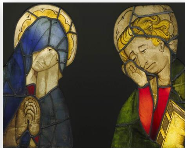
تصویر ۵: نقاشی دوره گوتیک (URL: 5)