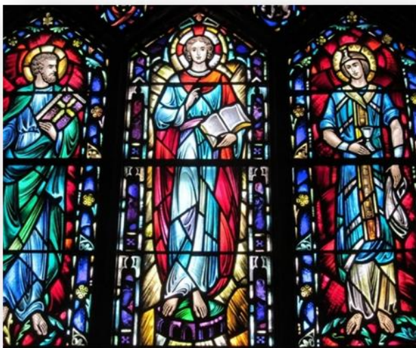
تصویر ۶: شیشه نقاشی شده دوره گوتیک (URL: 6)