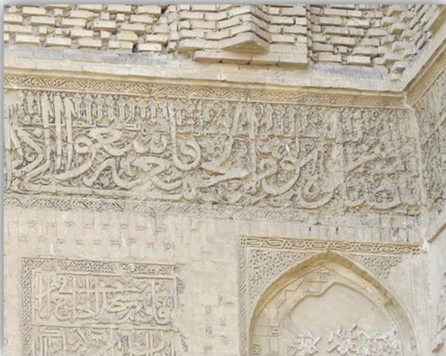
تصویر ۴: نقوش گچی قرآنی مسجد جامع ورامین (URL: 4)