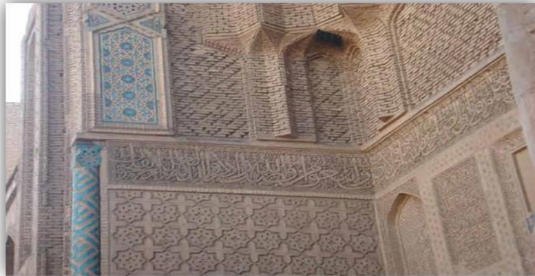
تصویر ۹: خطاطی برجسته دوره ایلخانی (URL: 9)