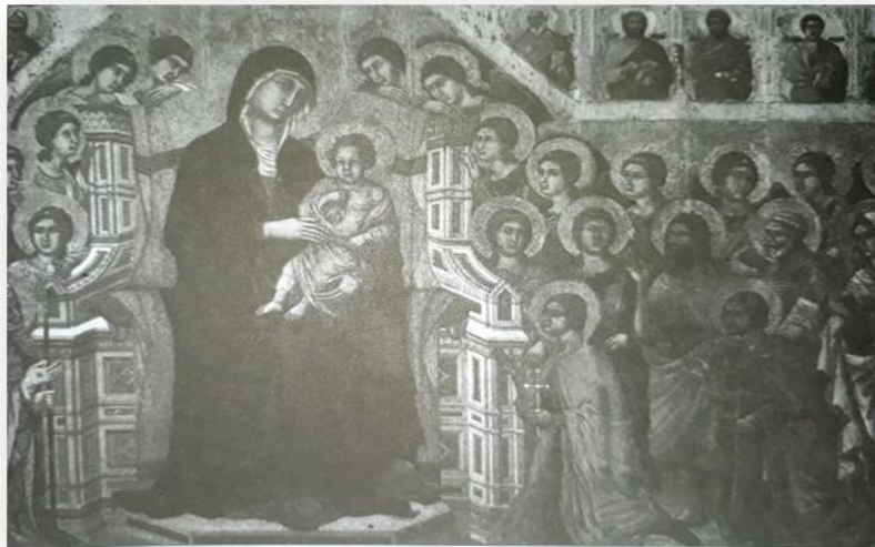
تصویر ۸: علیا حضرت، موزه کلیسا جامع، سی‌ینا، ایتالیا (کتاب جامع گوتیک)

در تصویر شماره (۸) نقاشی کشیده شده، دو چو دی بوانین (علیا حضرت، موزه کلیسا جامع، سی‌ینا، ایتالیا) بخش پیشین این اثر، مریم باکره را نشان می‌دهد که با شکوه و وقار تمام نشسته و فرشتگان و قدیسان او را احاطه کرده‌اند. این اثر به سبک بیزانسی کار شده و حالت یادمانی دارد. در پشت قالب بندی‌های چوبی اثر، روایت مصیبت حضرت مسیح به تفصیل آمده است. سبک نقاش شبیه سبک نقاشان دیواری است، اما در عین حال ظرافتی که نقاشی روی قالب چوبی طلب می‌کند در آن هوایداست. (براکونز، ۵۲:۱۳۹۱)