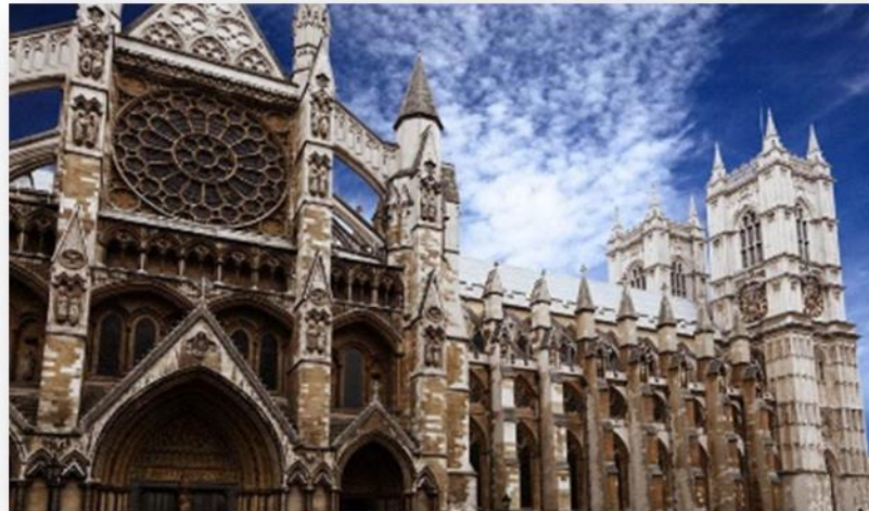
تصویر ۲: کلیسای وست مینستر (URL: 2)

فرهنگی هر ملتی میباشد؛ به بیان دیگر، تجلیگاه ریشه های فرهنگی و دینی تلقی میشود؛ تا آنجا که، اساس معماری دینی با بنیه های فرهنگی شکل می گیرد (ذکوات، ۱۳۹۶: ۵).