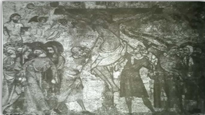
تصویر ۷: نقاشی‌های سالن غذاخوری کلیسای جامع پمپلونا، اسپانیا (کتاب رهانمای جامع گوتیک)

در تصویر شماره (۷) خوان اولیور (نقاشی‌های سالن غذاخوری کلیسای جامع پمپلونا، اسپانیا) این نقاشی‌ها که امضا و تاریخ ۱۳۳۰ میلادی را دارند، آغاز فاصله‌گیری هنرمندان گوتیک را از طراحی خطی ساده نشان می‌دهند. رنگ هم به نسبت آثار پیشین، اهمیت بیشتری یافته است. این صحنه مرکزی، مسیح را نشان می‌دهد که به سه میخ مصلوب شده است. به تصویر کشیدن نور فراوانی که از زخم‌های مسیح می‌چکد، بر رنج و عذاب او تاکید بیشتری می‌بخشد. خون، هنگامی که به جمجمه حضرت آدم در پای صلیب می‌رسد، نقش نجات بخشی خود را برای نوع بشر ایفا می‌کند. (براکونز، ۱۳۹۱)