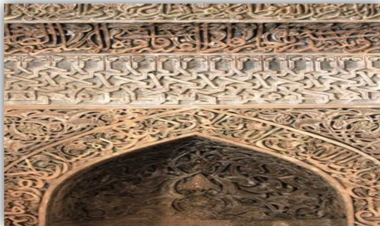
تصویر ۱۰: خطاطی گچی محراب الجایتو (URL: 10)