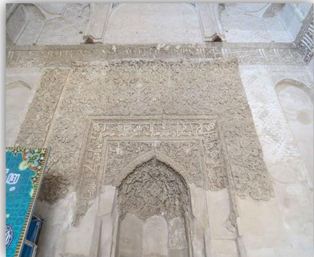
تصویر ۳: محراب گچکاری شده با خطوط گچی (URL: 3)