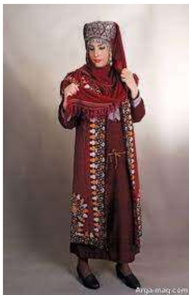
شکل ۱ - پیراهن زنان ترکمن