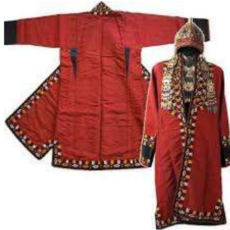
تصویر دوم: بالاپوش بانوان ترکمن (محمدی-۱۳۹۰)

چارقد روسری های بزرگی است که زنان ترکمن به سر می کنند. از جنس ابریشم بوده این روسری ها در طرحها و رنگ های متنوعی هستند و معمولاً گران قیمت اند و از این حیث با روسری های معمولی قابل مقایسه نیستند ولی امروز از چیت گلدار با یک ریشه بلند مکرومه دوزی است، می پوشانند.