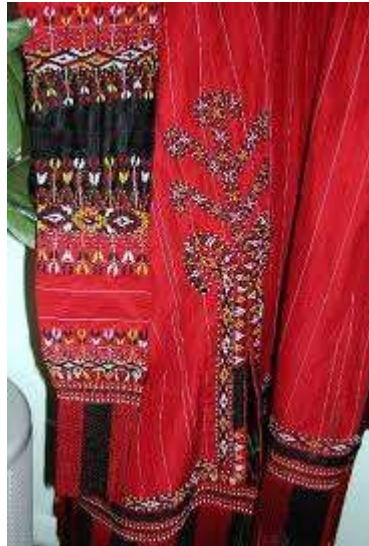
تصویر چهاردهم: سوزن دوزی با نقوش گیاهی (درخت)

تصویر نقوش گل و برگ که به حالت اشعه ای از شکاف پهلو لباس به بیرون تابیده است.