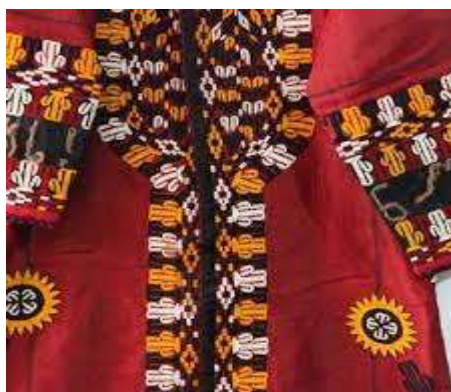
تصویر یازدهم: سوزن دوزی نقوش هندسی و نقوش طبیعی (خورشید)

نقش سواستیکا، نقش قوچک، طرح ترکمن (بخارایی) ترنجی، شمسه ای، کاسه و نیم کاسه، لچک، هندسی، درختی و غیره می باشد و پارچه های مورد استفاده بیشتر ابریشمی ، نخی، پشمی، به رنگ های مشکی ، نیلی ، زرد و قرمز می باشد. (پیمان متین- ۱۳۸۶)