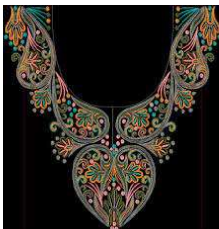
تصویر پانزدهم: سوزن دوزی بانوان ترکمن (گل و گیاه)

تصویر نقوش هندسی درلباس بانوان ترکمن و تاجیک که تاثیرات کاشی کاری و معماری ایران مشهود بوده و غنای نقوش هندسی درلباس نواحی مختلف و نیز دوره ای تاریخی قابل توجه است. (زهرای قوی پنجه - ۱۳۹۴).