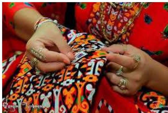
تصویر دوازدهم: سوزندوزی بانوان ترکمن (نگارنده)

نقوش بکار رفته در پوشاک ترکمن عبارتند از :