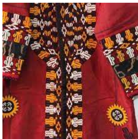
تصویر شانزدهم: سوزن دوزی بانوان ترکمن نقوش هندسی و گیاهی