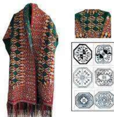
در تصویر دهم: نقوش هندسی

درباب نقوش و ترکیب سوزن دوزیهای ترکمن و سایر ملل کوچ را به یک باور مشترک می رسیم که همه اقوام با ساده ترین اشکال و خطوط سعی در رساندن پیام و ارتباط با هم نوع و بر جا گذاشتن آثاری از خود بودند .