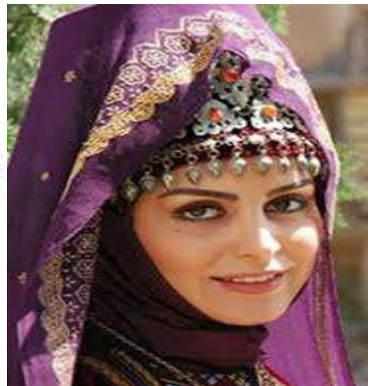
تصویر سوم: روسری و کلاه زنان ترکمن

کلاه: معمولاً زنان ترکمن بعد از ازدواج زیر روسری خود یک کلاه به سر می گذارند که نشانه متأهل بودن آنهاست. چادر ترکمنی: